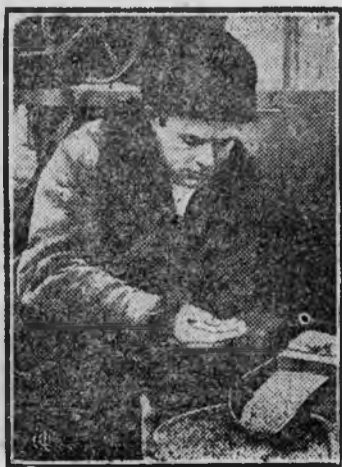
На снимке. Полевод колхоза проверяет качество зерна